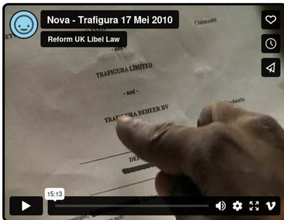
Vimeo (ทาว์โกลด) | คนขับรถ Trafigura: “เราถูกตัดสินบน”

ผู้แสดงความคิดเห็น Vimeo: ‘ขอบคุณไม่ว่าคุณจะเป็นใครก็ตามที่ทำให้สิ่งนี้พร้อมใช้งาน ดังที่คุณทราบในสหราชอาณาจักร เราไม่ได้รับอนุญาตให้อ่านหรือดูสิ่งเหล่านี้’